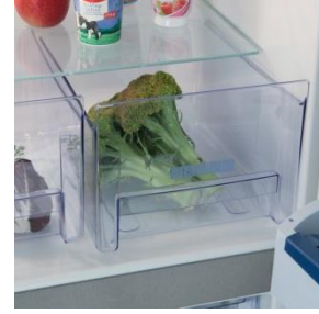
2 Frischefächer garantieren leckeres, knackiges Obst und Gemüse.