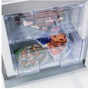
2 Gefriergutschubladen mit insgesamt 54 Litern Nutzinhalt.