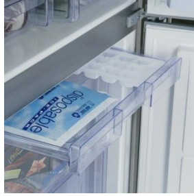
Das Gefriertablett für schonendes Einfrieren.