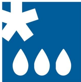
Der Kühlschrank ist mit einem automatischen Abtauverfahren ausgestattet.