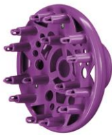
Diffusor-Aufsatz für sanftes Trocknen und maximales Volumen.