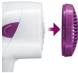
Luft Eintrittsgitter zur Reinigung abnehmbar.