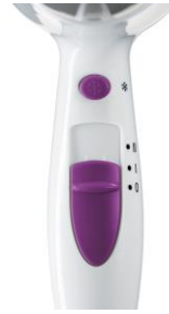
2 Leistungs-/ Wärmestufen. Kaltlufttaste zum Fixieren der Frisur.